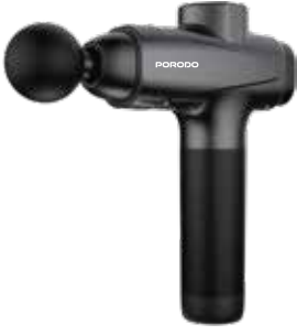
مسدس تدليك واحد