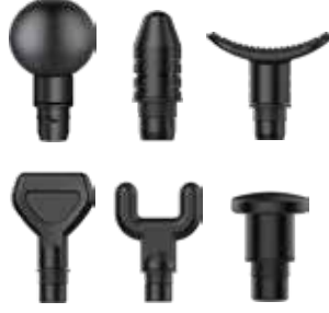
٦ رؤوس تدليك